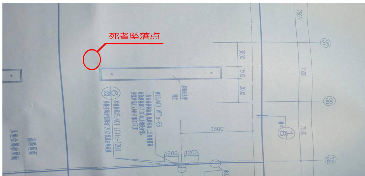
图 1 坠落点 1#成品厂房定位图