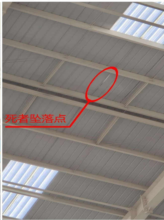
图 3 坠落点实图